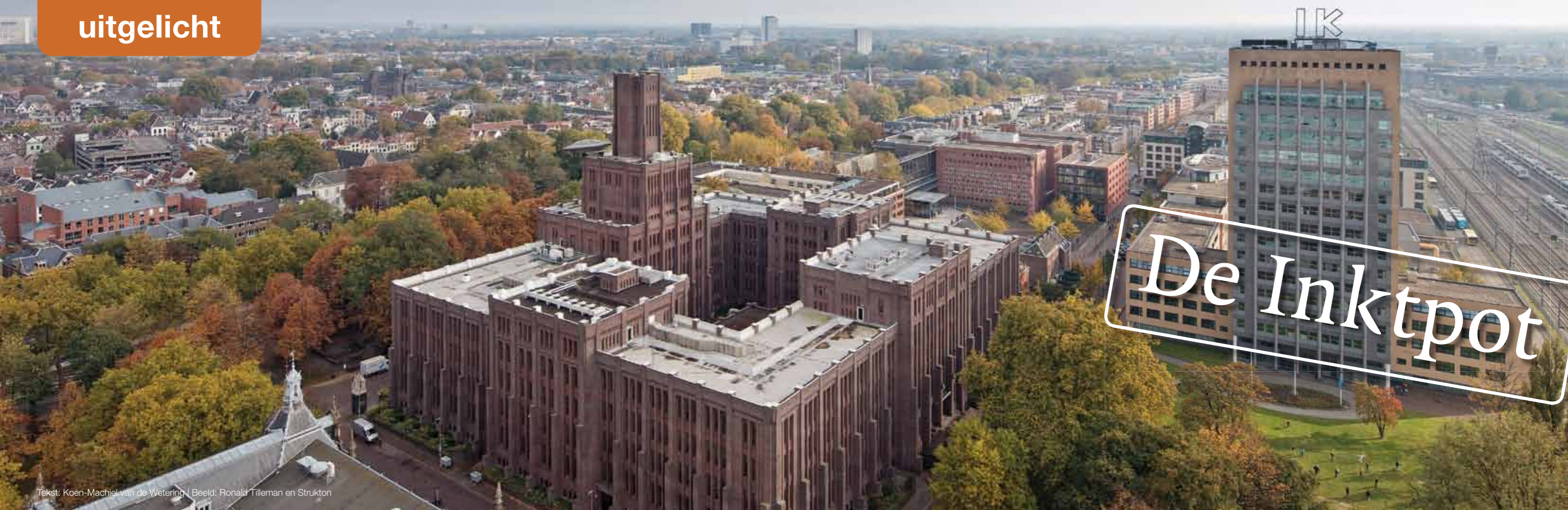
Tekst: Koen-Machiel van de Wetering | Beeld: Ronald Tilleman en Strukton